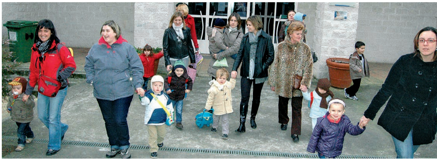
Varias madres acuden a recoger a sus hijos a las aulas maternas del colegio San Félix. (PAULA FERNÁNDEZ)